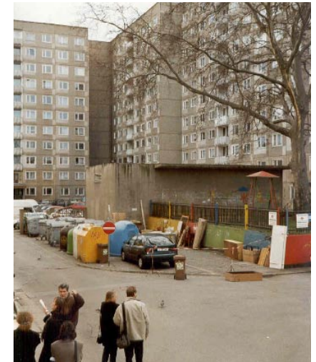
Wo verbringen Sie und Ihre Familie Ihre Freizeit im Freien?

Die Ermittlung von Aufwertungs- und Rückbaupotenzial wird in der Rahmenplanung und in der Folge durch erste Abrisse in der Realität umgesetzt.